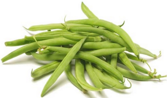
UN HARICOT VERT