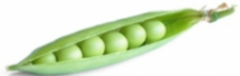
UN PETIT POIS